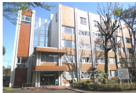
中央高等技術専門校

具体的には、埼玉県(中央高等技術専門校)に依頼して「水道設備工事図面」に特化したオーダーメイド型CAD講習として構成し、JwとAuto-CADの連携・合成などの技術を習得する中級者レベルの方を対象として次のとおり実施しました。