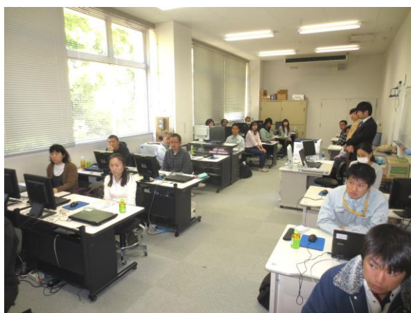
講習会場 全景(PC教室)