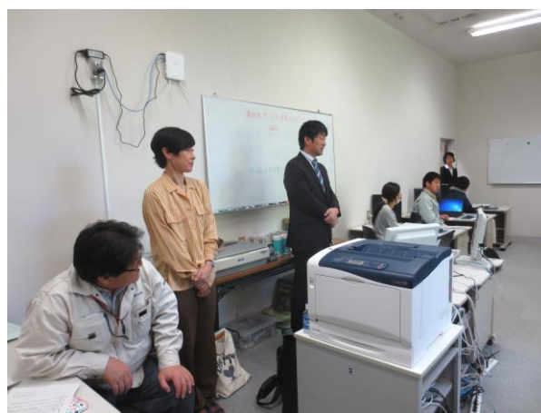
講師及びアシスタント2名、計3名の講師陣